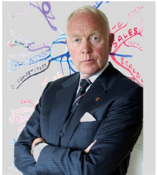
Tony Buzan: Inventor de los mapas mentales

Se basaba en una idea central expresada en una imagen que, a su criterio (basado en sus estudios e investigaciones), una representación visual del tópico estimula la memoria, asociaciones y pensamientos, seguida de ramas con las ideas primarias que debían ser curvilíneas, pues atraen al cerebro y lo incentiva a pensar en una forma natural y orgánica. Estas ramificaciones son conocidas como Ideas Básicas Ordenadoras (BMI por sus siglas en inglés) y se derivaban en ideas de niveles inferiores hasta que sea comprendida la esencia del tema.